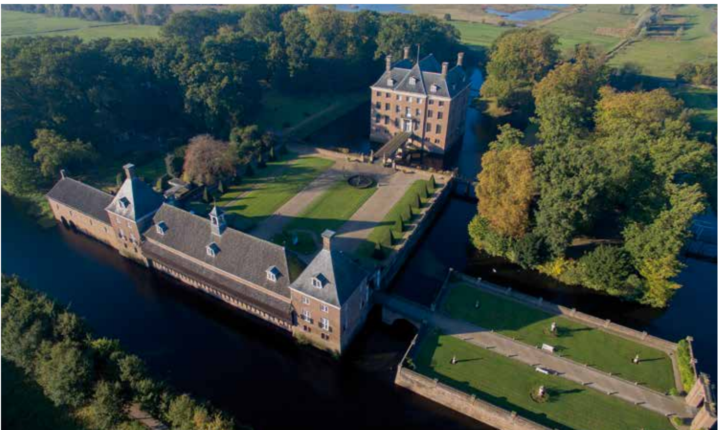
De route naar Kasteel Amerongen verliep via bruggen, poorten en rechthoekige eilanden.