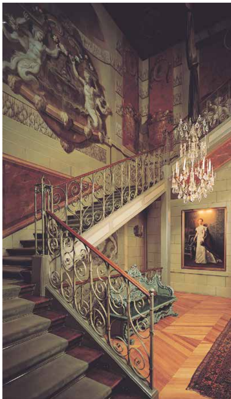
De staatsietrap van Slot Zeist is versierd met fraaie schilderijen.

Eenmaal binnen, houdt het visuele spel van zichtlijnen niet op. De grote ontvangsthall bevindt zich op de belle etage , traditioneel de belangrijkste verdieping. Direct achter de voordeur is een nieuwe zichtas. Dit keer kan er dwars door het slot worden gekeken, omdat alle vertrekken aaneen zijn geschakeld met de deuren in elkaars verlengde. Dit enfilade rangschikken was populair in de Franse paleisarchitectuur. Alle vertrekken op de as kijken uit op het voorplein, dat hierdoor bij het interieur is betrokken. Langs de as zijn ook de pronkstukken van Slot Zeist gesitueerd: het rijk gedecoreerde trappenhuis en de Grote Zaal, beide ontworpen door de Franse hugenoot Daniël Marot die goed bekend was met de stijl van Louis XIV. Het trappenhuis had in zijn tijd al een ongekende monumentale positie, want het was direct ontleend van l'Escaliers des Ambassadeurs van Versailles, hier vertaald als staatsietrap. De wanden zijn gestuukt en versierd met fraaie schilderijen in trompe l'oeuil , die de illusie oproepen van rijke materialen, levensechte vazen, bloemen en guirlandes (slingers). In latere eeuwen is het grootste deel van het terrein verkocht