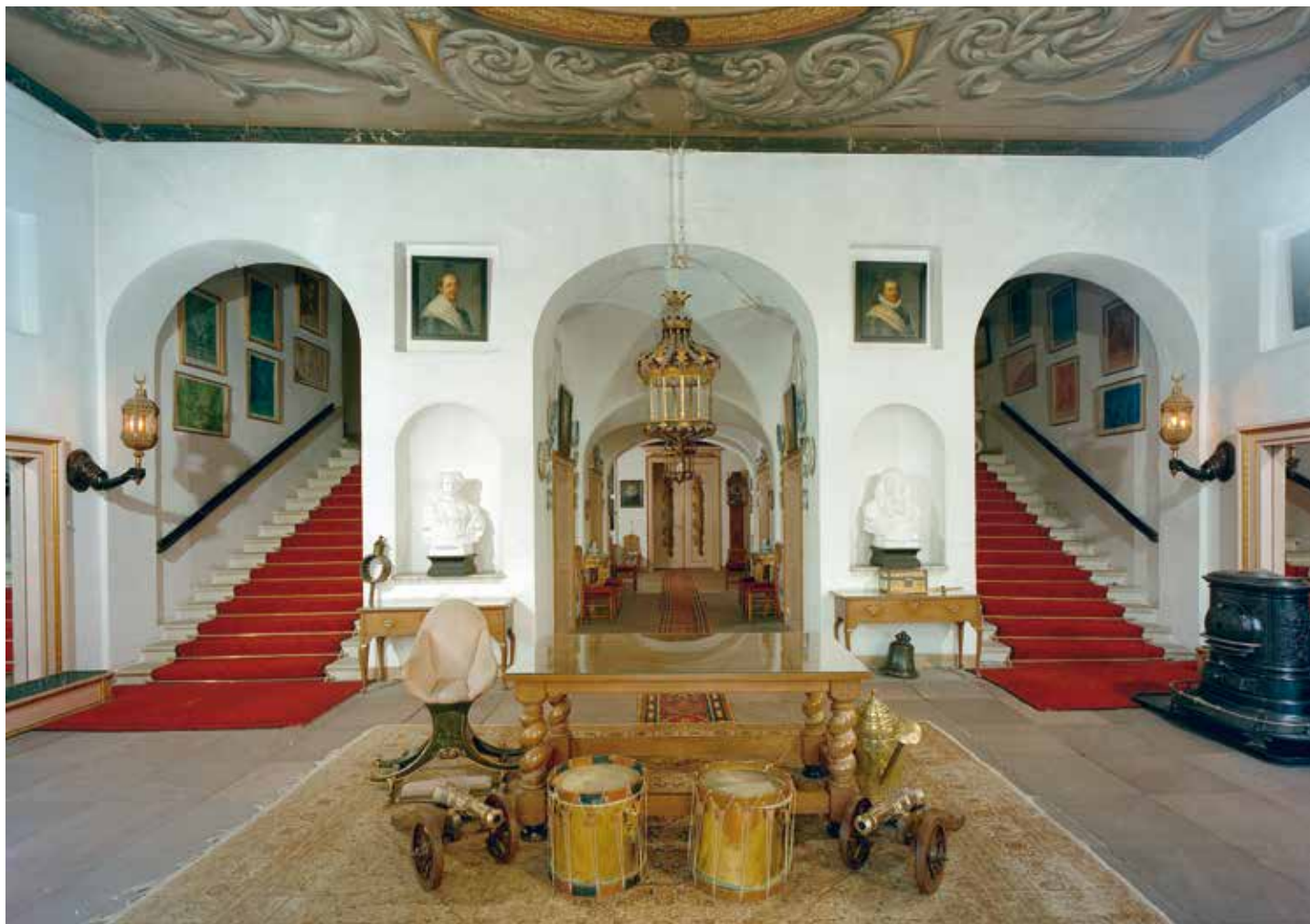
Voor een voorname uitstraling werd de ontvangsthal van Kasteel Amerongen voorzien van een dubbele trap.

Bij de toegang tot Kasteel Amerongen speelde de route en het zicht ook een belangrijke rol. De route verliep via bruggen, poorten en rechthoekige eilanden. Het eerste eiland is ommuurd met een poort en een toegangsbrug. Hierdoor kreeg Amerongen net als Kasteel Breda een besloten karakter. Vanaf het tweede eiland is het zicht op het kasteel juist optimaal. Doordat de brug naar de belle etage van het kasteel is verhoogd met een trappartij, lijkt het alsof het huis op een podium staat. Het lage muurtje aan weerszijden van de trap versterkt dit effect. Deze zichtlijn stopt niet bij de voordeur, maar loopt door de ontvangsthal naar de centrale Grote Zaal. Om de symmetrie te