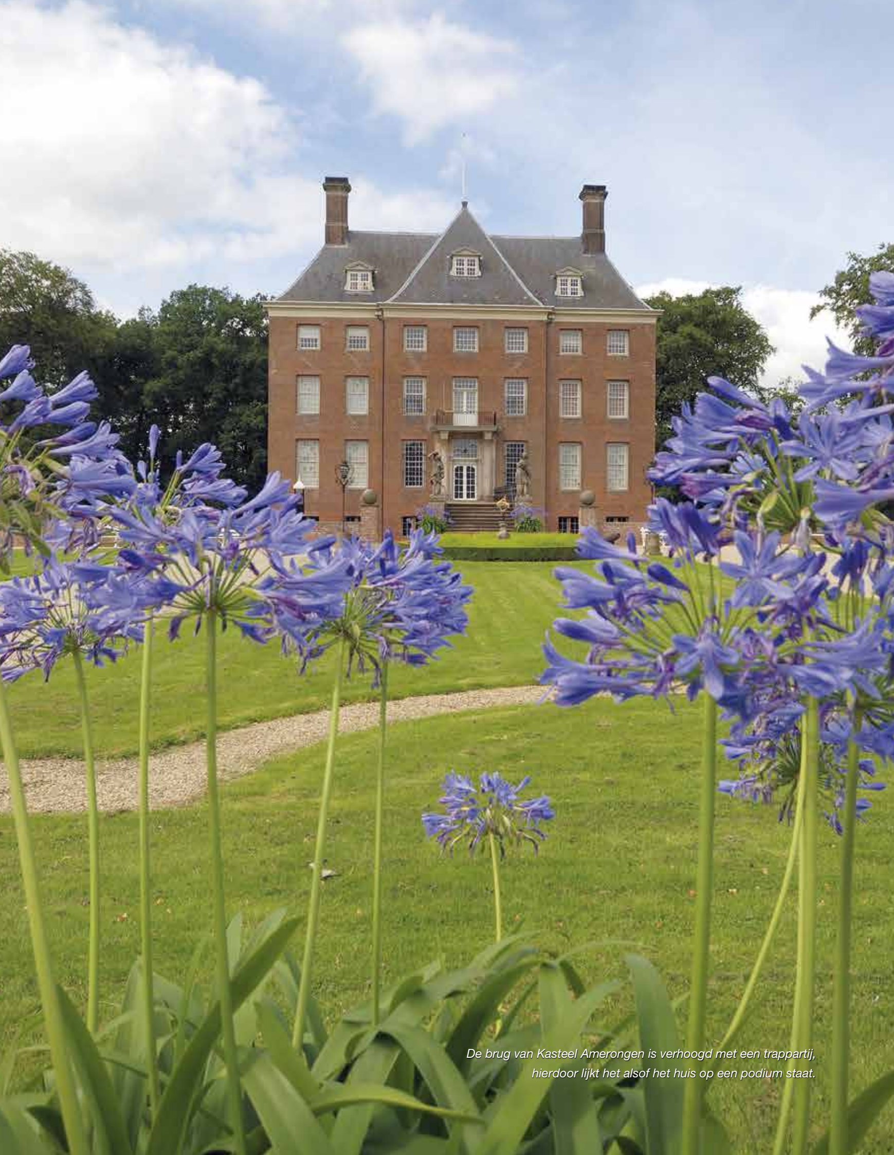
De brug van Kasteel Amerongen is verhoogd met een trappartij, hierdoor lijkt het alsof het huis op een podium staat.