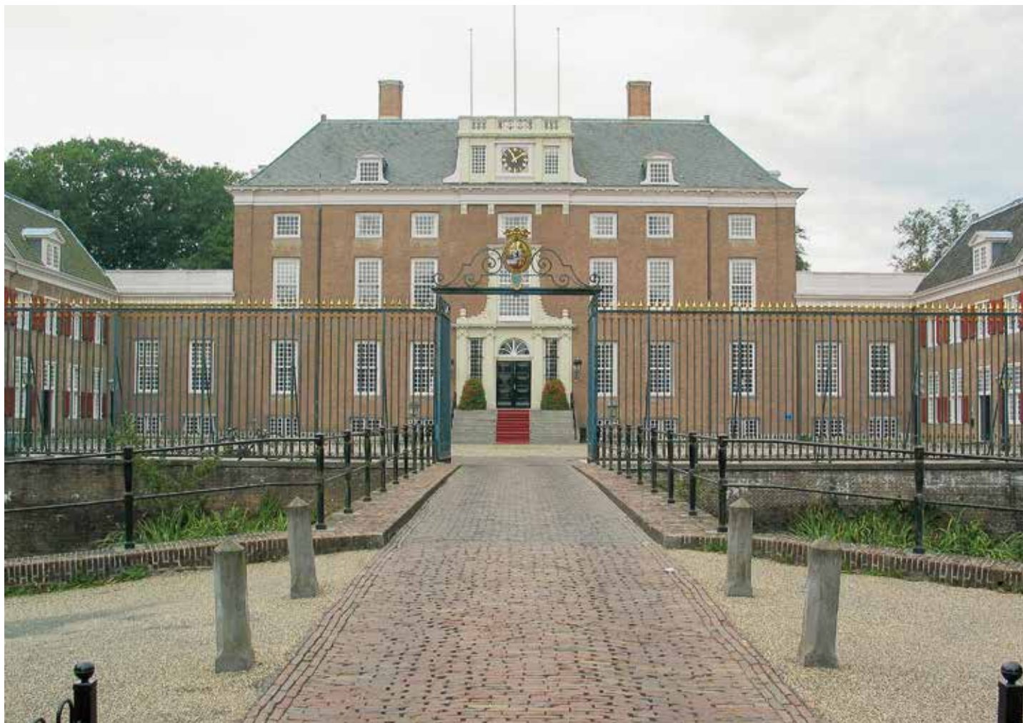
Slot Zeist. Het hekwerk creëert dieptewerking en stuurt het oog automatisch naar de ingang.

vatte in 1677 het ambitieuze plan op om in de ambachtsheerlijkheid Zeist en Driebergen een vorstelijk kasteel te bouwen. Uiteindelijk zou op een terrein van 318 hectare een