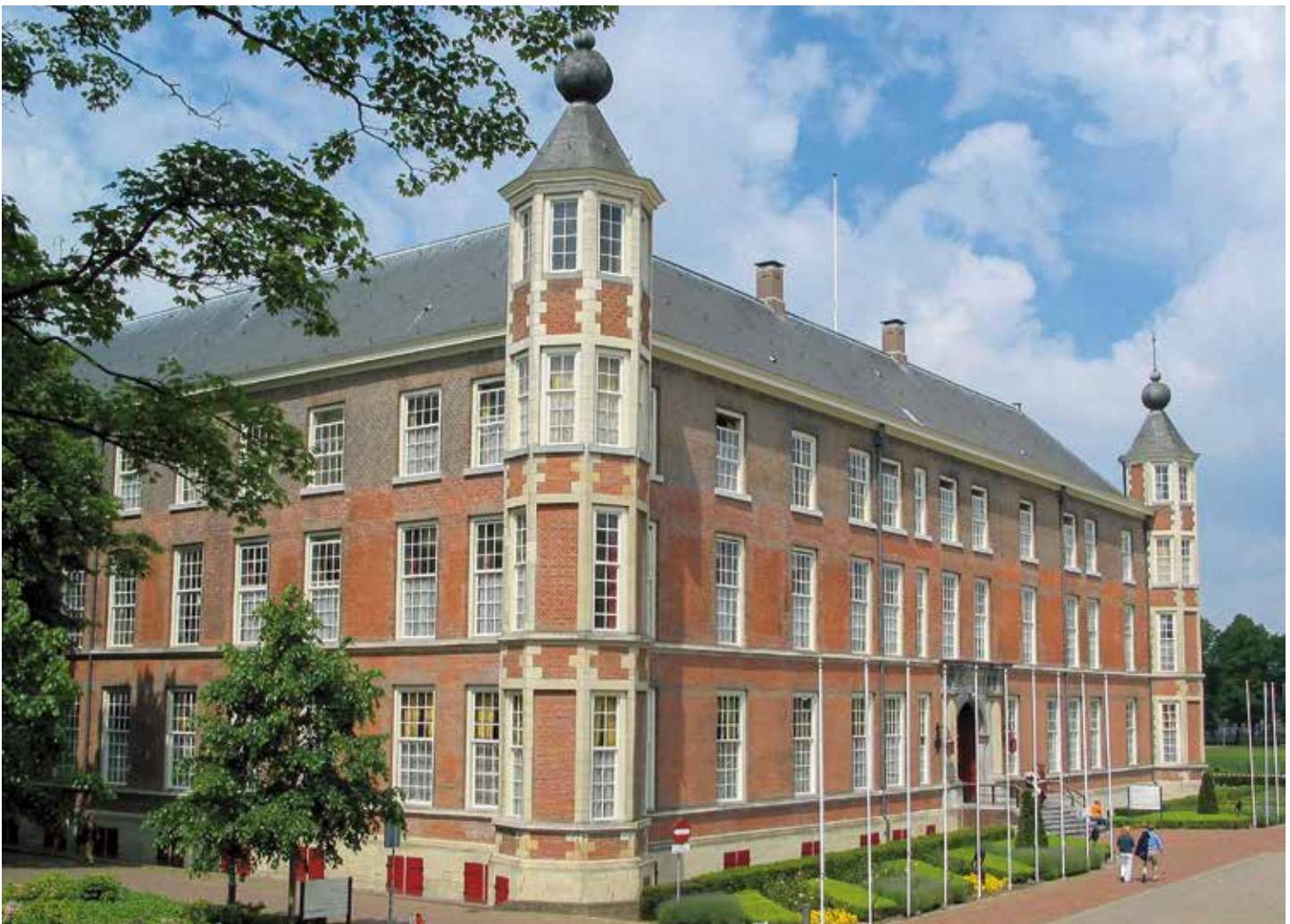
Kasteel Breda had een zeer besloten karakter. Gewoon volk kwam niet verder dan de slotgracht en de buitenpoort.